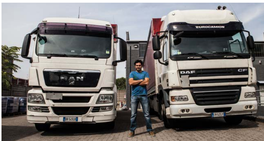
La Spelta può contare su 2 motrici centinate: un DAF CF (Euro5) 3 assi e un MAN TGF (Euro 4) 4 assi.

Oggi la Spelta ha solo due veicoli di proprietà e due autisti dipendenti più un magazziniere ed